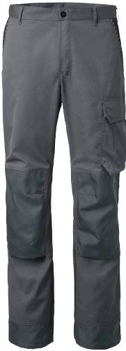
Bukser uden knælommer