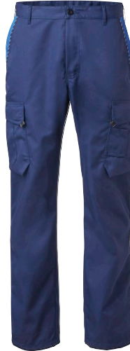
Bukser med knælommer